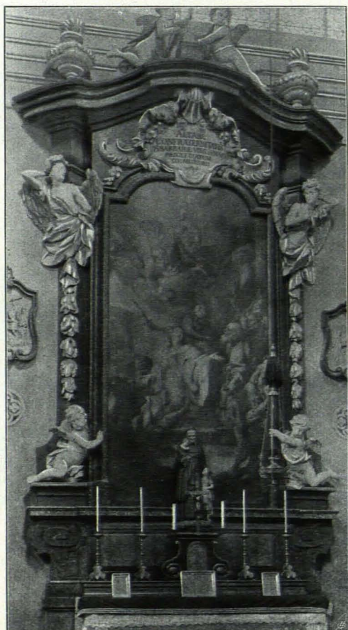
Fig. 303 Johannesspitalskirche, östlicher Seitenaltar (S. 666)

Rechteckiges, grau gefärbeltes Gebäude mit östlich angebauter Kirche, deren Sockel und Hohlkehlegesims die des Gebäudes fortsetzen. Die Kirchenfront ist von Eckpilastern eingefasst; rechteckige Tür in Rahmung mit Ohren und geradem Sturze, darüber vergittertes, rundes Fenster mit abgesetztem Rundbogenabschlusse in Rahmung mit Sohlbank, darüber gerahmtes Ovalfenster. Im aufgesetzten, gestutzten Giebel breitovales Fenster; an der östlichen Langseite drei hohe Fenster mit abgesetztem Rundbogenabschlusse in Rah-