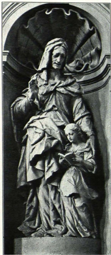
Fig. 298 Johannesspitalskirche, Statue der hl. Anna (S. 260)