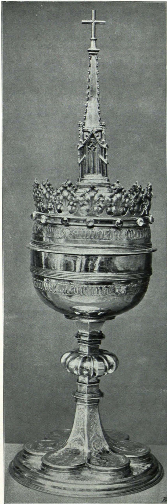
Fig. 267 Bürgerspitalskirche, Ziborium (S. 232)