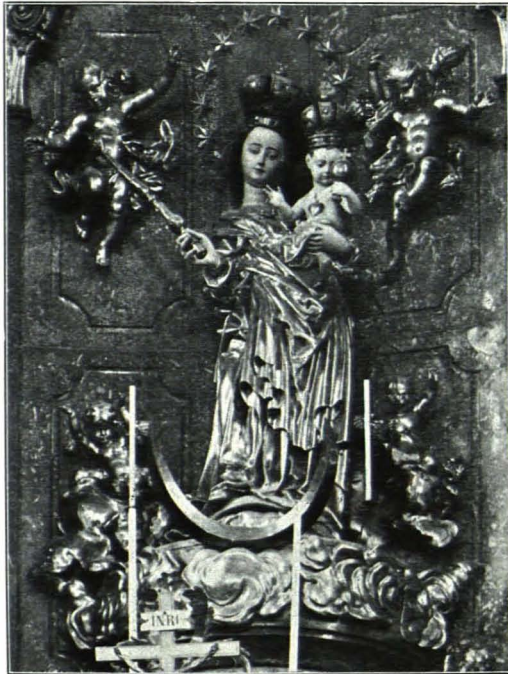
Fig. 238 Augustinerkirche, Madonnenfigur auf dem Hochaltar (S. 205)

Die Wände sind braun gefärbelt, die Tonnengewölbe über den Stiegenarmen und die Kreuzgewölbe über den Podesten weiß; nur das ausgestaltete Gewölbe des ersten Podestes ist braun mit lichterem Stuckornament, Bandwerk in Blätter auslaufend, mit Kartuschebildern in