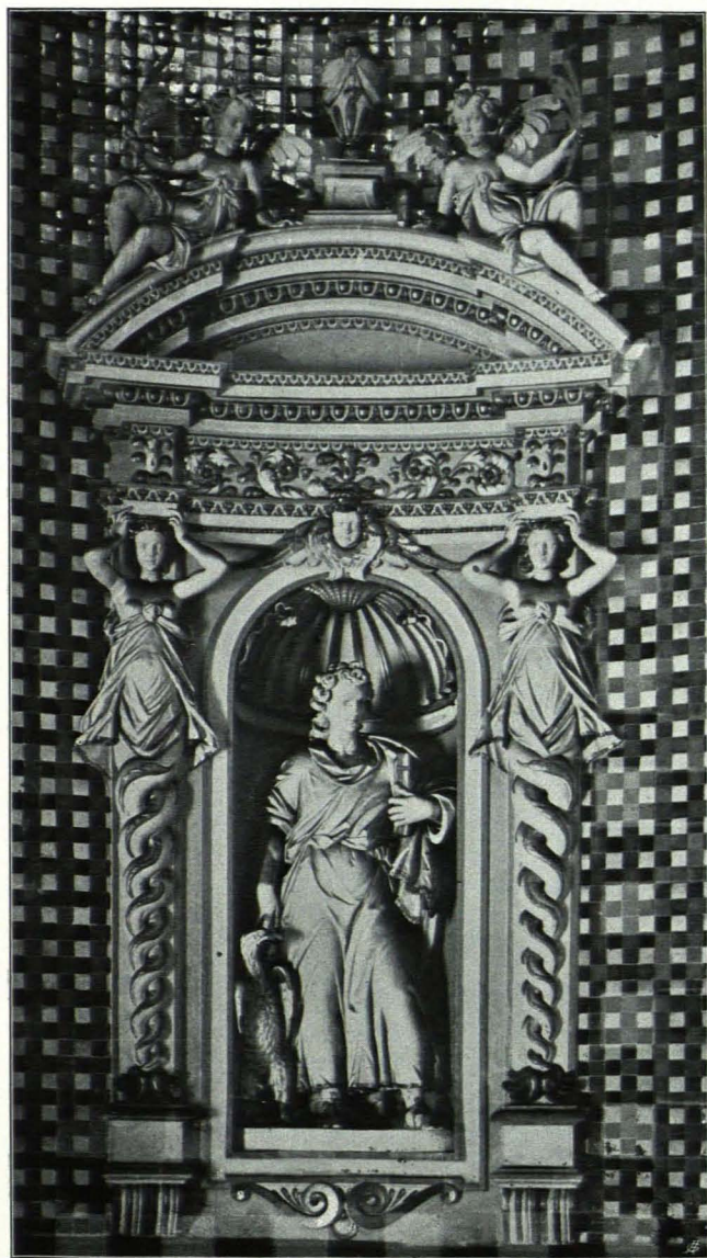
Fig. 171 Gabrielskapelle, Evangelistennische im Hauptraume (S. 137)