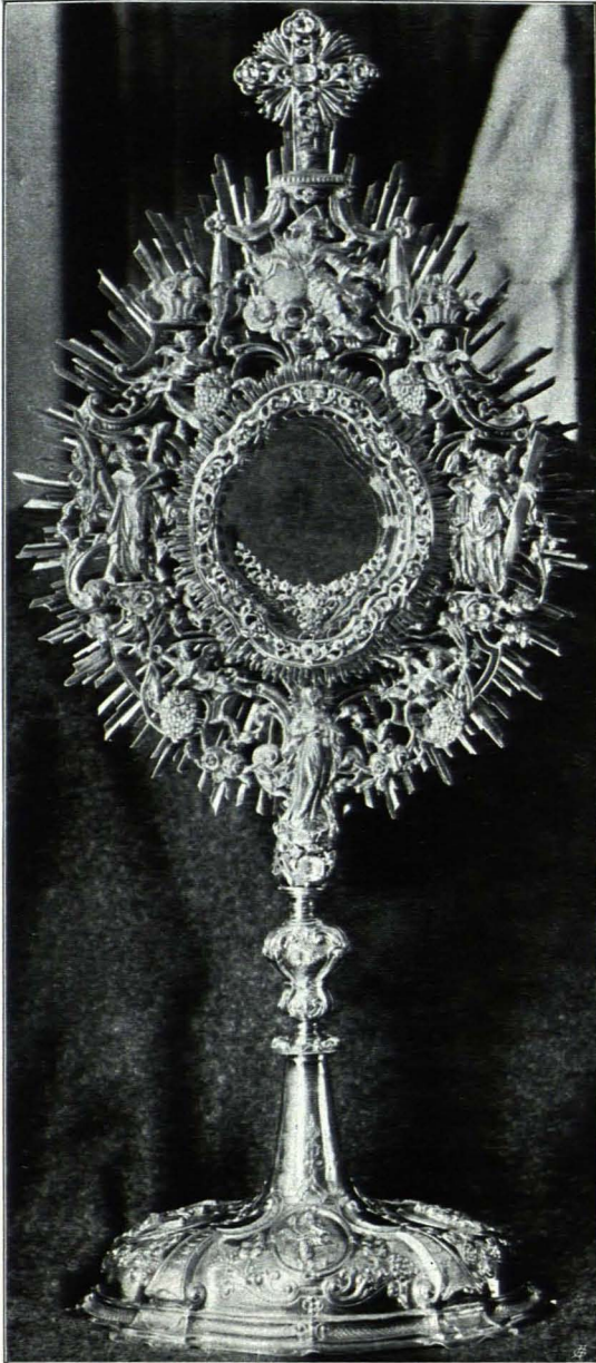
Fig. 153 Andreaskirche, Monstranz (S. 121)

T a s s e : Silber, mit gewelltem Rand und getriebener Blatt- ranke um vier perlgefaßte Medaillons mit Werkzeugen der Passion in getriebenem Relief; die Führung in Perlfassung, darin graviert Namenszug Jesus und Mariae. Münchener Beschau und Meistermarke I G O ; vielleicht Johann Georg Oxner, ROSENBERG 2 2287. Ende des XVII. Jhs.