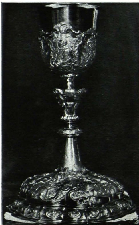
Fig. 152 Kajetanerkirche, Kelch Nr. 1 (S. 120)