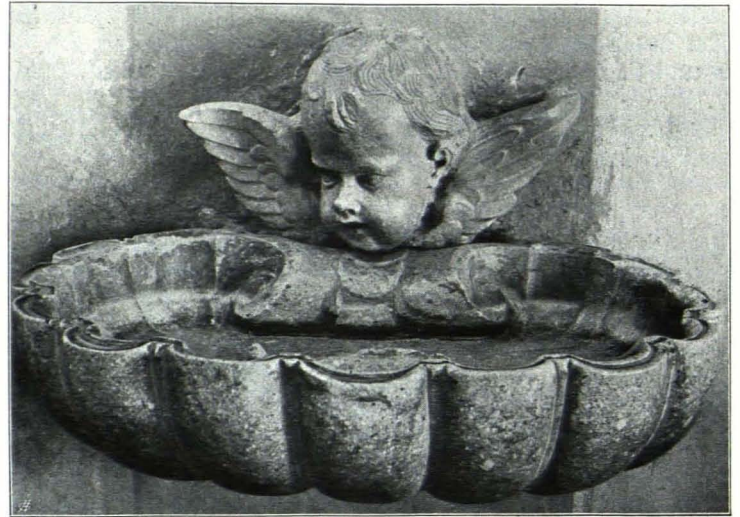
Fig. 151 Kajetanerkirche, Weihwasserbecken (S. 120)

In der Sakristei in verglaster Wandnische mit rahmendem Stukko: Baldachin und Volutenwerk, Kruzifixus, das Korpus vergoldet an Ebenholzkreuz. Mitte des XVIII. Jhs.