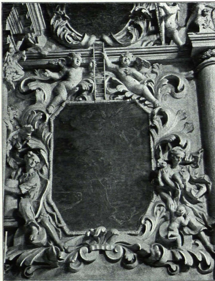
Fig. 124 Franziskanerkirche, Detail aus der Franziscikapelle (S. 93)

Der Altar mit moderner Mensa, seitlich auf hohen Postamenten Säulen, deren Kapitäle von Adlern gebildet sind. Darüber über Kämpfern ausladendes Gebälk über Konsolenfries, vor dessen leicht geschwungener Mitte ein Engel mit Kranz schwebt. Über dem Gebälke breiter Aufsatz mit einem kartuscheförmigen Bilde in profilierter Rahmung und einem giebelförmig aufgeboenen Abschluß mit monochrom gemaltem Franziskanerkreuz im Felde und drei bekrönenden Putten. Seitlich vom Aufsatzbilde Cherubsköpfchen. Außerhalb von diesen auf dem Abschlußgebälke jublierende Engel. Seitlich von den flankierenden Säulen große Gewandengel auf Blattranken über Adlern, die auf den Postamenten der Säulen sitzen.