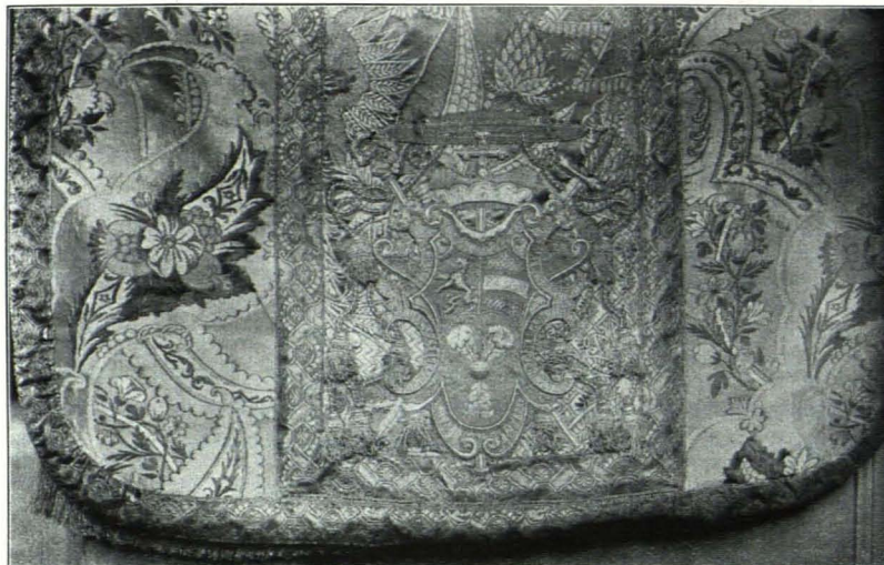
Fig. 87 Domschatz, Detail der Kasel Nr. 15 vom Harrachschen Ornat (S. 59)

Fransen besetzt. Derbes Leinenfutter. Der Tradition nach Stola des hl. Rupert benannt, wohl sicher erst der Mitte des XIII. Jhs. angehörend (Taf. XVII a); vgl. JOS. BRAUN in Zeitschr. für christl. Kunst 1909, 179). 2. 274 cm lang, 6 cm breit; in Goldfäden und bunter Seide gestickt; verflochtenes Rautenmuster. In der Mitte verblichenes Agnus Dei in Medaillon. Die Endstücke enthalten in einer Kielbogennische unter Zinnenbekrönung je eine Bischofsfigur; Abschluß durch rote und grüne Fransen. Taffutter.