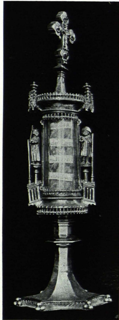
Fig. 70 Domschatz, Reliquiar (S. 53)