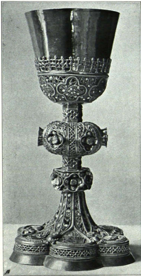
Fig. 54 Domschatz, Ziborium (S. 43)

Korbfassung besetzt ist. Der Hauptteil des Nodus zwischen zwei sechsseitigen Einschnürungen in Form eines zusammengedrückten Knaufes ist durch sechs Vierpaßbänder in sechs Felder geteilt, deren jedes mit einer Rosette wie unten besetzt ist; die beiden Einschnürungen sind mit eingblendetem Vierpaßmaßwerk zwischen profilierten Führungen besetzt. Der Korb der Cuppa enthält in sechs gekordelten Vierpässen Filigranrankenwerk mit Emailblüten auf Emailgrund und ebensolches Ornament in den Zwickeln und ist mit einem Kreuzblumenfries über gekordeltem und profiliertem Abschlusse besetzt. Am unteren Rande Repunzen, im Fuße Würdenzeichen und Salzburger Beschauzeichen