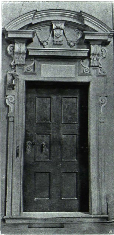
Fig. 28 Dom, Sakristeitür (S. 23)

Die Westwand ist etwas abweichend gestaltet; die Seitenflügel, ebenfalls in zwei Geschosse geteilt, enthalten flache Schränke, dazwischen von hohen Pilastern eingefasste hohe Rundbogennische; unter dieser die rechteckige Haupttür mit gravierten und ausgeschnittenen Beschlägen und mit volutengerahmtem Aufsatz. In einem Wandschrank an dieser Seite Lavabo aus Zinn mit reich gebuckeltem Behälter, rechteckig mit abgeschragten Kanten; an der Vorderseite über der modernen Pipe graviertes Firmiansches Wappen. Der Deckel ist mit Delphinen mit verschlungenen Schwänzen bekrönt. Um 1730; Marke des Joseph Anton Greissing (RADINGER I 21).