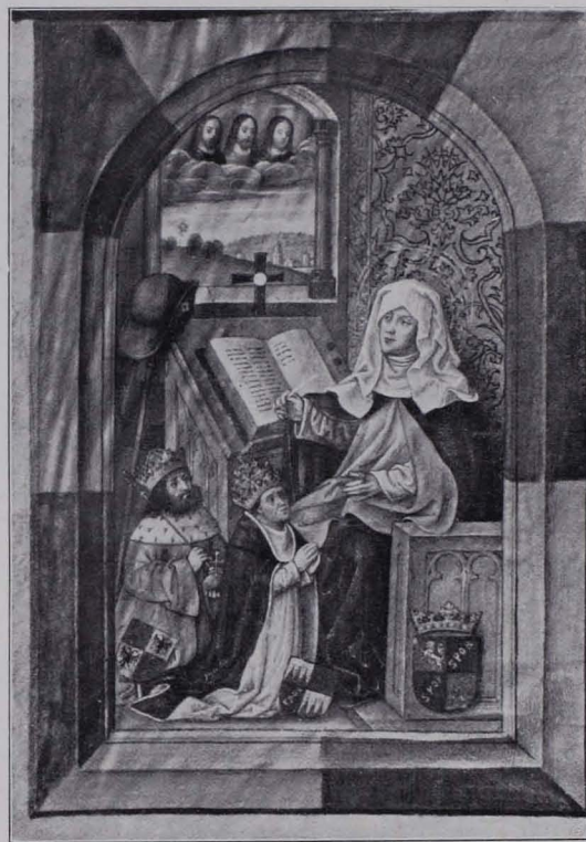
Fig. 262 Gebete der hl. Birgitta, Titelbild (S. 185)