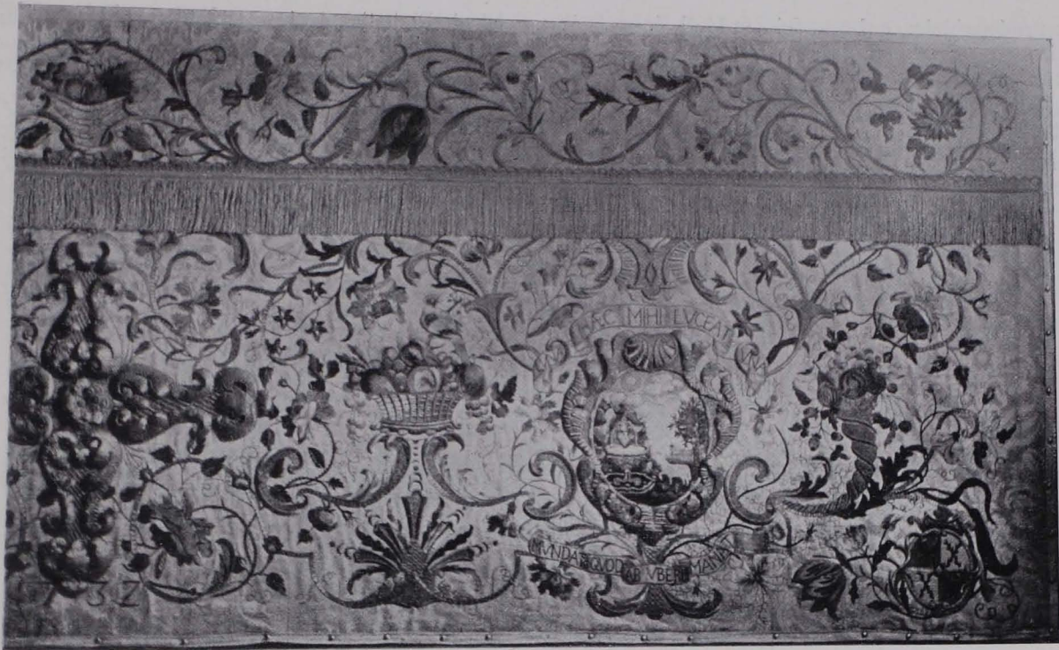
Fig. 231 Antependium mit Gold- und bunter Seidenstickerei von 1732 (S. 163)