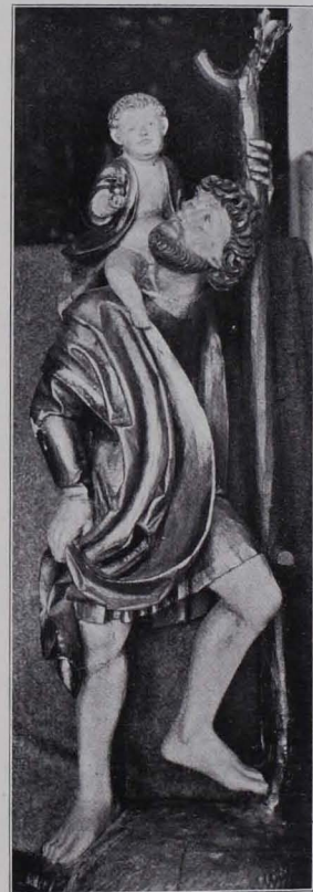
Fig. 186 Hl. Christoph (Skulptur 33, S. 136)