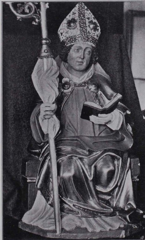
Fig. 185 Sitzfigur eines hl. Bischofs (Skulptur 31, S. 136)