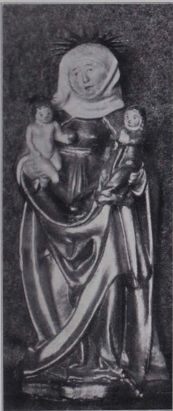
Fig. 184 Hl. Anna Selbdritt (Skulptur 27, S. 133)