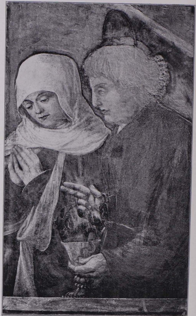
Fig. 156 Maria und Johannes Evangelist (Gemälde 27, S. 120)

35. Öl auf Kupfer; 15 \times 24 . Hl. Magdalena, vor dem Kruzifixus kniend. Landschaft mit einer Stadt im Hintergrunde. Links unten signiert: PF(H[?]). Anfang des XVII. Jhs. In schwarzem, profiliertem Rahmen.