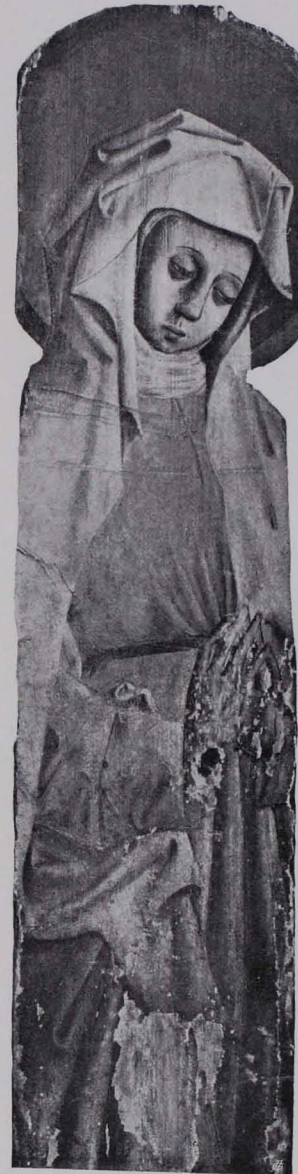
Fig. 146 Fragment von einer Kreuzigung (Gemälde 11, S. 112)

Mittelschrein kielbögig abgeschlossen; 1·10 × 1·73. Kreuzigung Christi zwischen Maria und Johannes; im Mittelgrunde bewaffnete Reiter und Fußsoldaten. Links und rechts Hügel mit dunkelgrünen Bäumen,