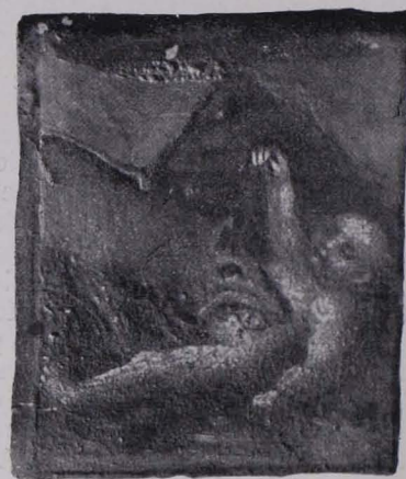
Fig. 135 Malerei am Faltstuhl (S. 103)

Berichtes, etwa einer Legende, zu glauben. Einzelne Stücke beziehen sich bestimmt auf die Legende des hl. Eustathius (Eustachius). Der hl. Eustathius läßt sich, durch das bekannte Jagdwunder erschüttert, taufen, wandert mit seiner Frau und zwei Söhnen aus, verliert die Frau, die der Schiffsherr mit Gewalt im Schiff zurückbehält; auf der Weiterreise kommt er an einen reißenden Strom, über den er den einen