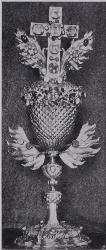
Fig. 120 Reliquiar Nr. 1 (S. 95)

Bildaufsatz: 61 cm hoch. An hölzernem, schwarzen Kerne appliziertes, struktives, vergoldetes und dekoratives Silberblechornament. Postament mit seitlich ausspringenden Volutengliedern, die Form durch die Metallverkleidung betont, mit flamboyantem Ornamente und bekrönender Blumen vase. Das Bild darauf rechteckig, segmentbogig abgeschlossen, in Rahmen mit flamboyanten Appliken, herum kartuscheförmige Einfassung aus Voluten und flamboyanten Ornamenten um neun kartuscheförmige, verglaste Reliquiennischen. Als Bekrönung Namenszug Mariä vor Glorie. Das Bild (Email) Tod des hl. Josef. Maria