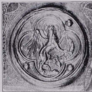
Fig. 115 Symbol des hl. Markus von Reliquiantafel Nr. 1 (S. 92)