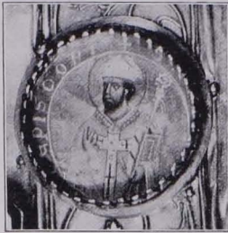
Fig. 112 Detail von Reliquiantafel Nr. 1 (S. 92)