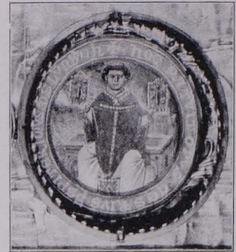
Fig. 114 Stifterbildnis von Reliquiantafel Nr. 1 (S. 92)

und angesetzten Spitzblättern und Rosetten verziert. In der Mitte hochovales Medaillon, mit später eingesetzten Reliquien des hl. Dionysius, in Glas und gezahrter Fassung. Die äußeren und inneren Ränder des ganzen Rahmens mit Steinen in Kastenfassung besetzt. Gegen den schief vertieften, in den Ecken mit Rosetten, sonst mit einfachen Nägeln befestigten Mittelteil der Bildtafel aufgelegte Bordüre mit Perlenschnur. Im Grunde Darstellung der Kreuzigung (Taf. XVI). Auf vertieftem Kreuze frei aufgesetztes, rund gegossenes Korpus mit stark vorgenommenen, leicht nach links gewandten Knien, zwischen den