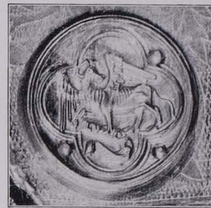
Fig. 116 Symbol des hl. Lukas von Reliquiantafel Nr. 1 (S. 92)