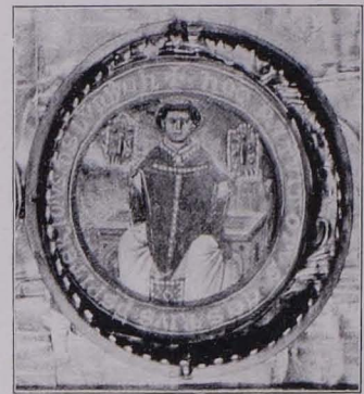
Fig. 114 Stifterbildnis von Reliquientafel Nr. 1 (S. 92)

und angesetzten Spitzblättern und Rosetten verziert. In der Mitte hochovales Medaillon, mit später eingesetzten Reliquien des hl. Dionysius, in Glas und gezahnter Fassung. Die äußeren und inneren Ränder des ganzen Rahmens mit Steinen in Kastenfassung besetzt. Gegen den schief vertieften, in den Ecken mit Rosetten, sonst mit einfachen Nägeln befestigten Mittelteil der Bildtafel aufgelegte Bordüre mit Perlenschnur. Im Grunde Darstellung der Kreuzigung (Taf. XVI). Auf vertieftem Kreuze frei aufgesetztes, rund gegossenes Korpus mit stark vorgenommenen, leicht nach links gewandten Knien, zwischen den