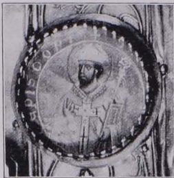
Fig. 112 Detail von Reliquientafel Nr. 1 (S. 92)

Der oberste Teil des Rahmens dreipaßförmig ausgebaucht; die ganze Fläche mit getriebenem Rankenwerk