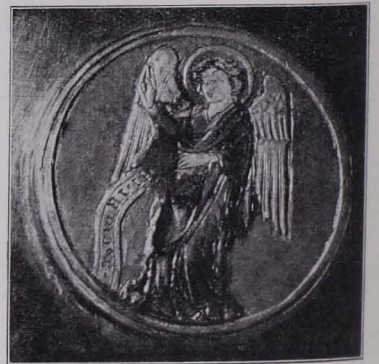
Fig. 109 Medaillon in Tiefschnittschmelz am Haupt der hl. Erentrud (S. 89)

Darauf das streng frontal gestellte Haupt der Heiligen (Taf. XV), deren glatte Büste an der Vorderseite durch eine Halskette unterbrochen wird; diese besteht aus einer von Steilrändern eingefassten, durchbrochenen Blattranke, in die bunte Halbedelsteine in ausgelappter Kastenfassung eingesetzt sind. Zwei Äste führen senkrecht empor, zwischen denen zwei andere mit einem Medaillon auf die Brust herabhängen (die scheinbar unter den herabhängenden Haaren fortgeführte Kette bricht vor ihnen ab). An der Vorderseite der Schultern je ein Rundmedaillon, in Tiefschnittschmelz auf Silber, in steiler Fassung;