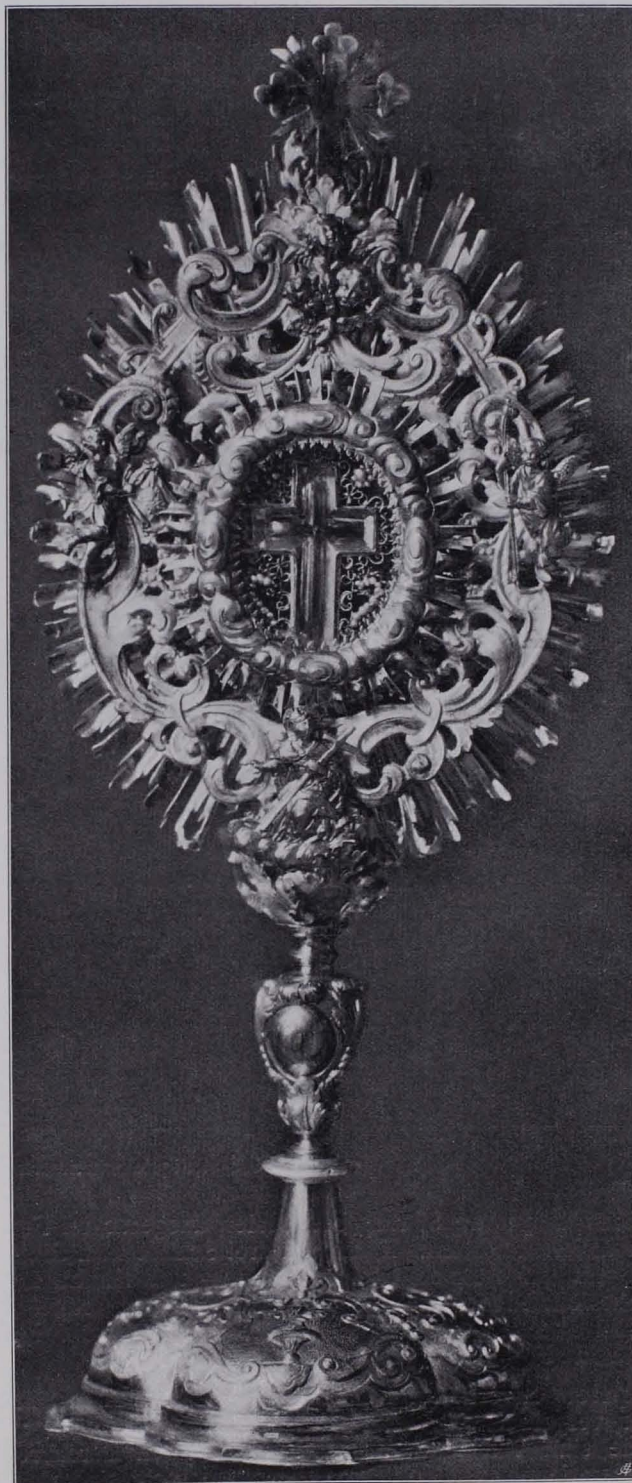
Fig. 105 Kreuzpartikel (S. 84)

Das Kreuz wurde 1494 von der Äbtissin Daria von Panichner dem Konvent gegen das Versprechen eines Jahrtages gestiftet; es wurde von dem Goldschmied Peter Sporel von Wasserburg, der 1465 in den Bürgerbüchern von Salzburg erscheint) um XLV \bar{a} VII \beta \delta gearbeitet (s. S. XXIII).