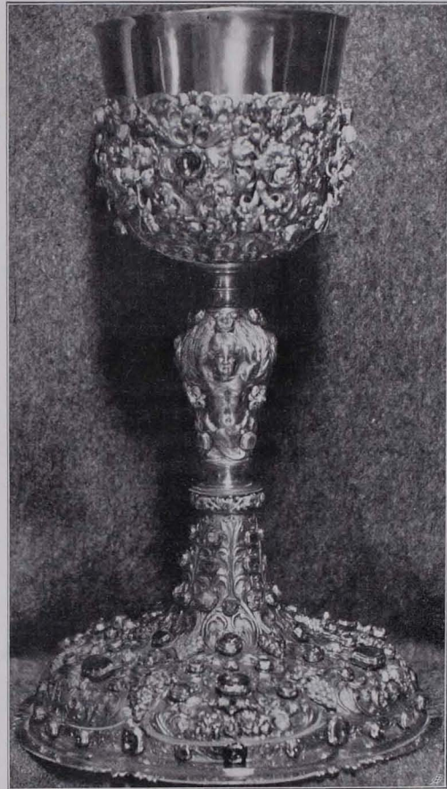
Fig. 100 Kelch Nr. 10 (S. 78)