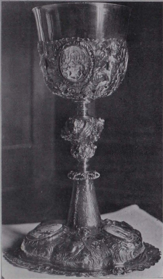
Fig. 99 Kelch Nr. 9 (S. 77)

8. Silber, teilweise vergoldet; 25 cm. Sechslappiger Fuß mit getriebenen, großen Blumen und Blattranken und drei aufgesetzten, silbernen Cherubsköpfchen. Am Knaufe getriebene Halbfiguren dreier Engel über volutenumrahmten Blumenbuketts und auf gerauhtem Grunde, der zwischen den Flügeln medaillonartig vortritt, silberner, durchbrochener Korb aus Blattranken, Blüten und Trauben. Salzburger Beschau, Meistermarke H. J. S und Repunzen. Um 1670. Arbeit des Hans Jakob Scheibsradt, Bürger seit 1653. —