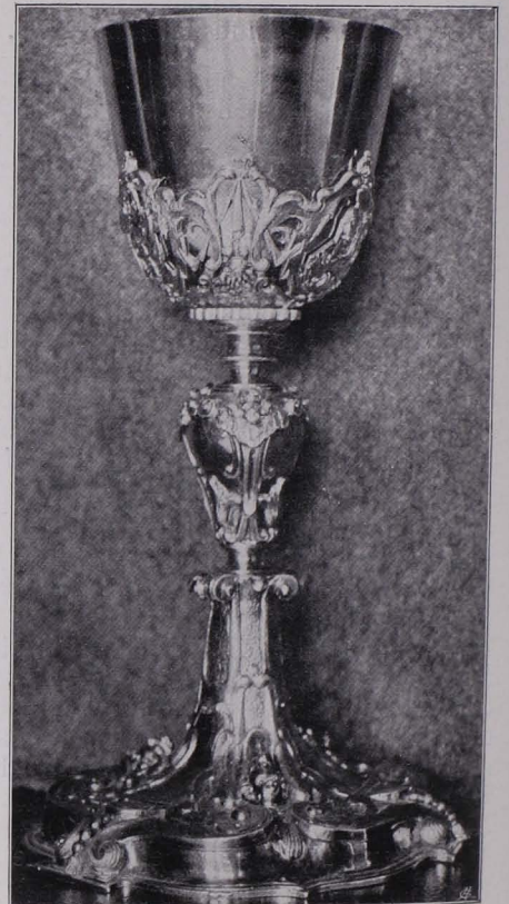
Fig. 98 Kelch Nr. 3 (S. 76)

6. Silber, teilweise vergoldet; 24·5 cm. Sechslappiger Fuß, drei aufgelegte, querovale Medaillons mit Maleremail, zwischen getriebenem Blattwerke, mit aufgesetzten, vergoldeten Rosetten und silbernen Steh-Engeln mit Leidenswerkzeugen. Knauf mit