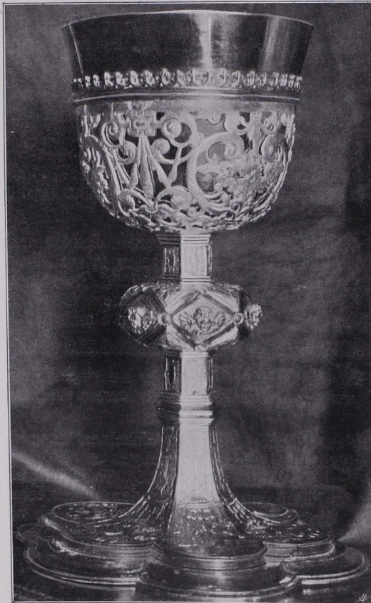
Fig. 97 Kelch Nr. 2 (S. 75)