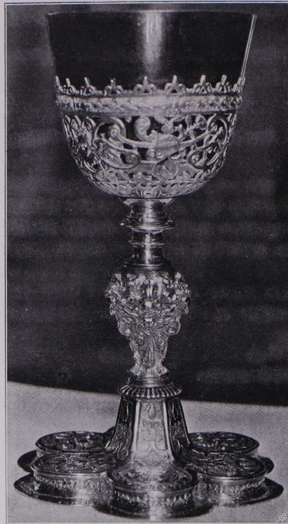
Fig. 96 Kelch Nr. 1 (S. 75)

Knorpelwerk und Rosetten. Korb aus großblumigem Silberblattwerke, mit aufgesetzten, vergoldeten Rosetten und querovalen Medaillons, die mit getriebenen Ähren, respektive Trauben und Blüten, geziert sind. Salzburger Beschau, Meistermarke wie bei Kelch Nr. 9, Würxenzeichen. Repunzen. Um 1670.