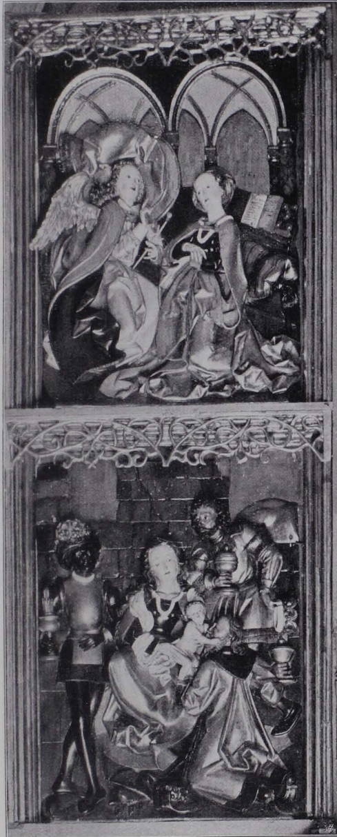
Fig. 76 Linker Flügel des Altars in der Johanniskapelle (S. 58)