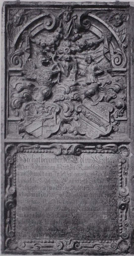
Fig. 54 Grabstein des Haimeran Rütz (S. 39)