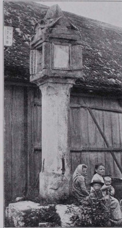
Fig. 141 Thaya, Bildstock (S. 141)