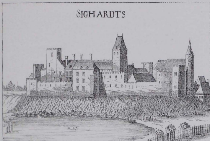
Fig. 135 Schloß Siegharts nach der Radierung von G. M. Vischer von 1672 (S. 137)

dann die Einpach, Waldstätten bis 1785 und die Edlen von Großer bis 1808 besonders hervorzuheben. Die Kapelle im Schlosse wurde 1708 hergestellt und hatte 1711 einen eigenen Kaplan. Sie enthielt 1734 einen Altar zu Ehren der schmerzhaften Mutter Gottes (Dekanatsarchiv Raabs). Anlage des XVI. Jhs. Am Anfange des XVIII. Jhs. vielfach adaptiert, am Ende des XIX. Jhs. umfassend restauriert (Fig. 135 und 136).