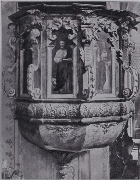
Fig. 112 Speisendorf, Pfarrkirche, Kanzel (S. 106)