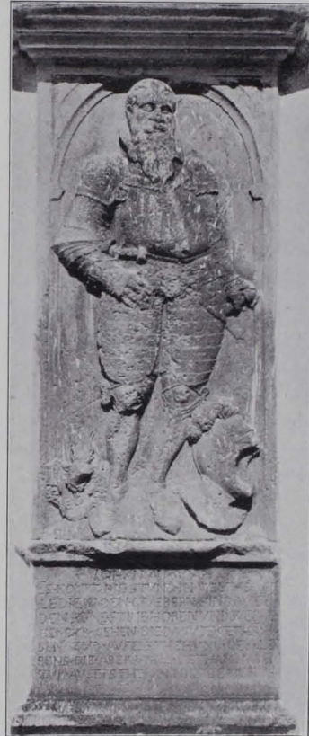
Fig. 91 Oberndorf (Raabs), Pfarrkirche, Grabstein (S. 86)