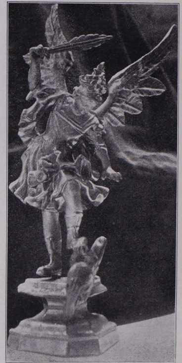
Fig. 87 Oberndorf (Raabs), Pfarrkirche, Statuette des hl. Michael (S. 85)

2. Öl auf Leinwand, rundbogig geschlossen, Sebastian und Rochus, stehend, dazwischen die liegende hl. Rosa, oben kleinfigurig hl. Dreifaltigkeit in Glorie. Schwaches Bild, aus der Mitte des XVIII. Jhs., vom ehemaligen Sebastianaltar stammend.