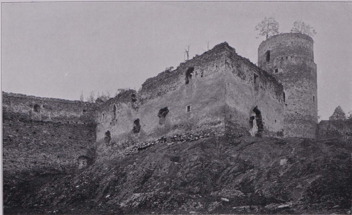
Fig. 69 Ruine Kollmitzgraben, Gebäude an der Nordseite des Hofes und Nordwestturm (S. 66)