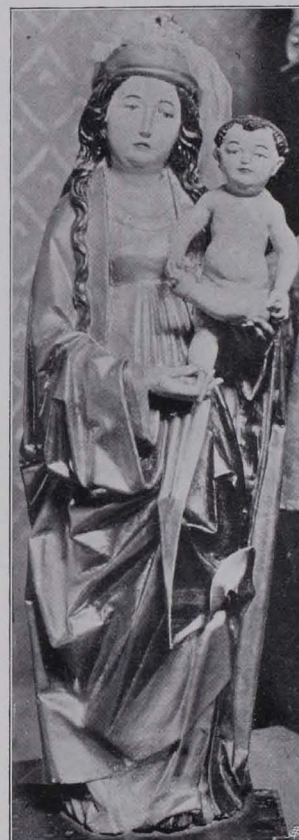
Fig. 47 Waldkirchen, Pfarrkirche, Madonnenfigur (S. 44)

Gemälde: Unter der Empore zwei Pendants, Öl auf Leinwand, Halbfiguren des hl. Petrus und hl. Hieronymus. Mittelmäßige Arbeiten, XVIII. Jh.