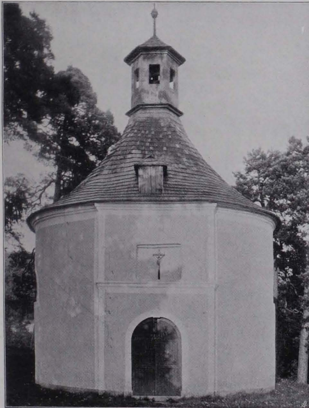
Fig. 26 Gilgenberg, Kapelle (S. 23)

(West-)seite durch einen breiten Pfeiler abgeflacht; darin Rundbogentür mit Keilstein in der Rahmung, darüber profiliertes Gesims, auf dem eine Bretnische aufsteht. Vier Segmentfenster; umlaufendes, um die Pfeiler verkröpftes Kranzgesimse. Schindeldach mit Haubendachfenster im W. und aufgesetztem tamburartigem Türmchen mit rechteckigen Öffnungen, Pyramidendach, Knauf und Kreuz. An der Südseite in der Kapellenwand: 1681.