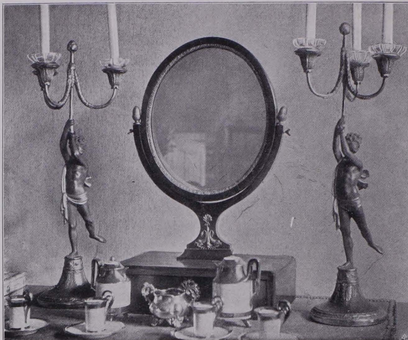
Fig. 16 Dobersberg, Schloß, Toilettegarnitur (S. 12)

Auf dem Schreibtische runde Uhr in Goldbronzemontierung auf einem aus vier Pranken gebildeten Fuß über quadratischem Postamente. Bezeichnet: Gaesner Wien .