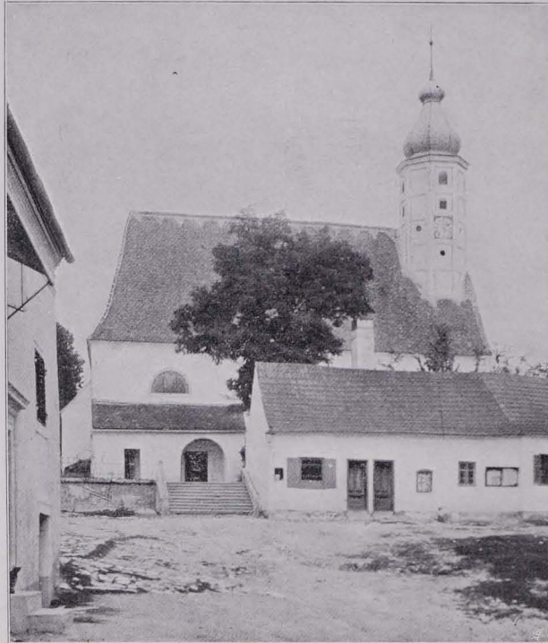
Fig. 181 Windigsteig, Pfarrkirche (S. 177)

Archivalien: Pfarrarchiv mit Matriken seit 1673 und Gedenkbuch. — Geschichte der Pfarre W. von JOHANN VON ERAST in GRÜBELS Manuskripten im Konsistorialarchiv St. Pölten.