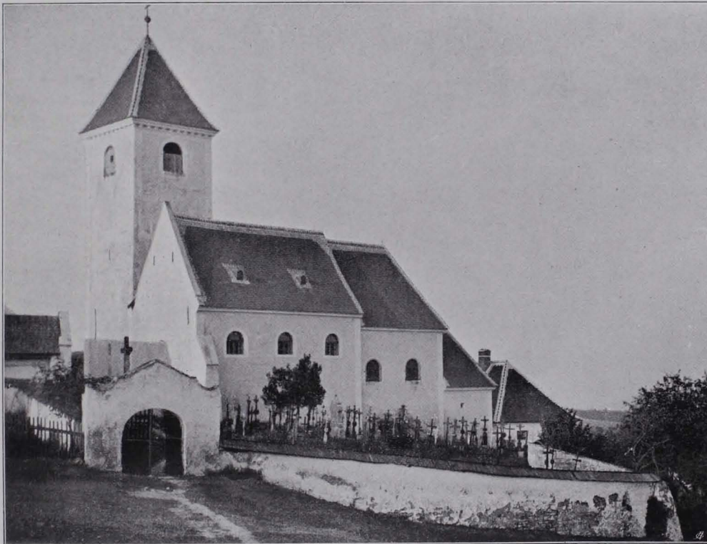
Fig. 129 Puch, Pfarrkirche (S. 128)