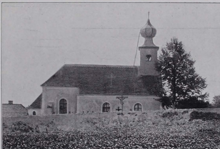
Fig. 127 Pfaffenschlag, Pfarrkirche (S. 125)

Beschreibung: Verbindung eines ursprünglich romanischen, 1876 sehr stark erneuten und 1910 abermals verlängerten Langhauses mit einem innen spätgotisch umgestalteten Chore. Unbedeutender Dachreiter nach 1850 (Fig. 127 und 128).