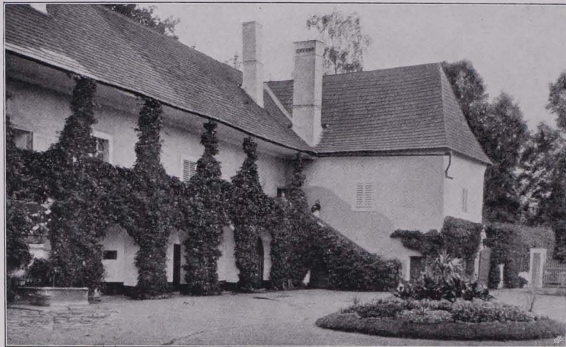
Fig. 125 Meires, Schloß (S. 122)

Der Ort wird 1232 zuerst genannt. Er bildete stets einen Bestandteil der gleichnamigen Herrschaft, deren Sitz, ursprünglich ein Wasserschloß, in der Hauptform noch erhalten ist. Dieses Gut erscheint schon im XIV. Jh. als landesfürstliches Lehen, doch lag der Sitz der Ritter von M. anfänglich nicht an der jetzigen Stelle im Orte, sondern jenseits der Thaya auf dem waldigen Gipfel des Burgholzes und lebt in der Volkssage als versunkenes Schloß fort. Das Geschlecht starb um die Wende zum XV. Jh. aus, die Feste M.