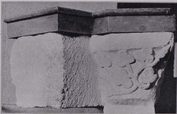
Fig. 117 Weikertschlag, Pfarrkirche, Taufkessel aus einem romanischen Kapitäl (S. 110)