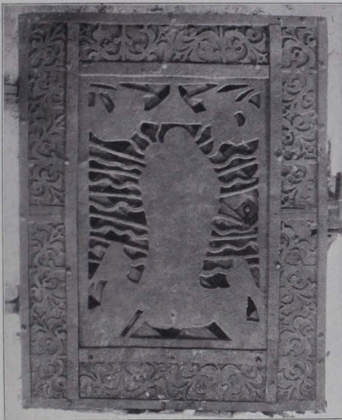
Fig. 116 Weikertschlag, Pfarrkirche, Eisengitter an der Rückseite des Hochaltars (S. 109)

Holz, marmoriert, mit geringer Vergoldung, Skulpturenaufbau; über gestuftem Unterbau wird der Wandteil durch jederseits zwei schräggestellte Säulen vertieft; gemeinsames, dreiteiliges Gebälk über jedem Flügel; der Mittelteil etwas überhöht, durch Segmentsturz abgeschlossen. Darauf, weiß gefaßt, die thronende Dreifaltigkeit, über dem Säulengebälke Statuetten zweier Heiligen.