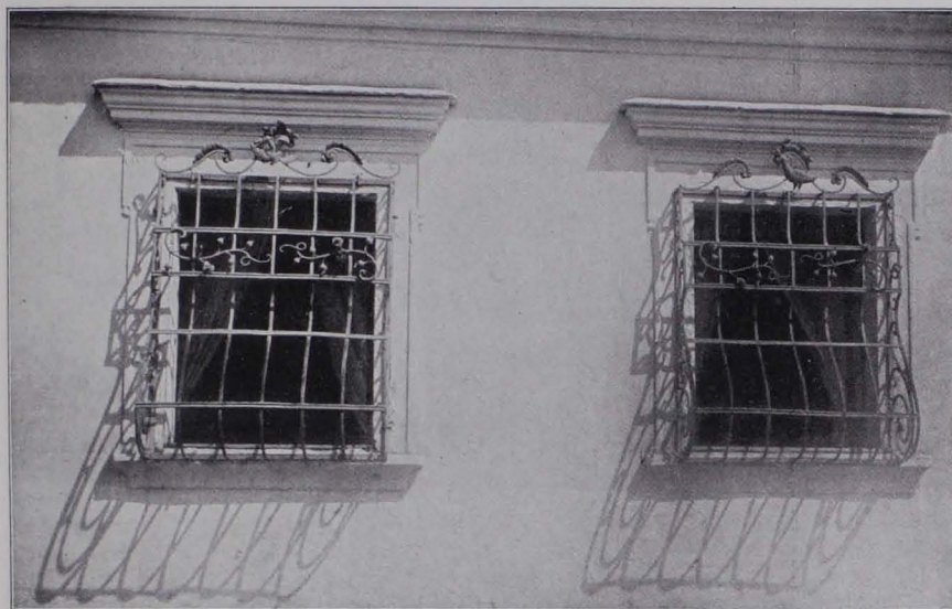
Fig. 118 Weikertschlag, Fenster des Hauses Nr. 44 (S. 111)

Privathaus Nr. 44: Auf dem Hauptplatze. Weiß gefärbeltes Doppelgebäude, dessen zwei Teile durch ein gequadrates Rundbogentor verbunden sind; durchlaufendes, profiliertes Gesims. Die Fenster des Untergeschosses beider Teile in profilierter Rahmung, mit eisernen Korbittern, mit vorgesetzten Blumen, Ranken, Vögeln und flamboyanter Bekrönung. (Drittes Viertel des XVIII. Jhs. Fig. 118.) In dem geschwungenen Giebel ovale Fenster; in einer Rundbogennische graue Steintafel mit Relief der Immakulata. Bekrönung durch Pinienzapfen und Kugel. Anlage vom Anfange des XVII. Jhs.