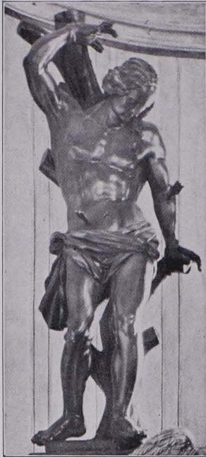
Fig. 103 Niklasberg, Pfarrkirche, St. Sebastian vom Hochaltare (S. 98)