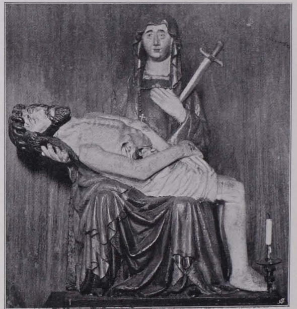
Fig. 104 Niklasberg, Pfarrkirche, Holzskulptur, Pietà (S. 98)

Im Pfarrhof Gemälde; Öl auf Leinwand; Halbfigur des Herrn Petrus Gröbner, Abtes von Pernegg, Erbauers des Pfarrhofes in N. Gutes österreichisches Bild, um 1760.