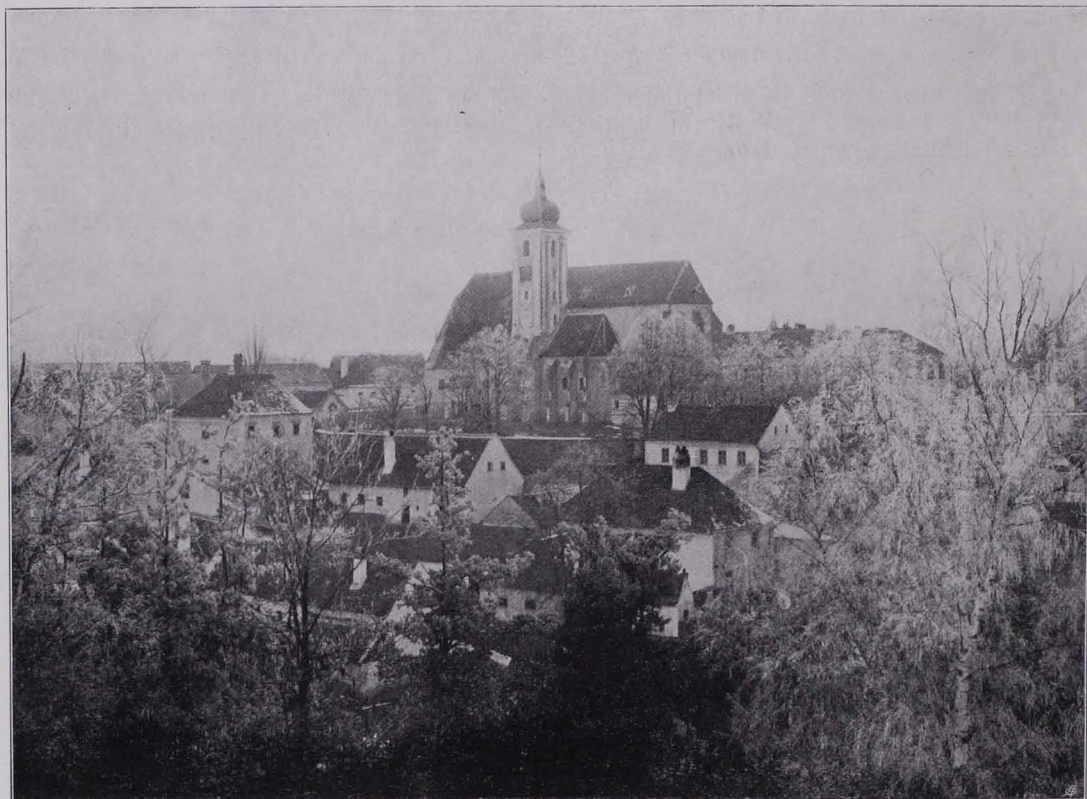
Fig. 74 Oberndorf (Raabs) mit der Pfarrkirche (S. 73)

Gemälde. Gemälde: Öl auf Leinwand. 1. Madonna mit dem Kinde auf einem Throne sitzend. Kopie des XIX. Jhs. nach einem Gnadenbilde des XVI. (eine ältere Kopie desselben Gnadenbildes befindet sich in der Kapelle in Hollenbach). 2. Maria Magdalena. Lokale Arbeit vom Anfange des XIX. Jhs.