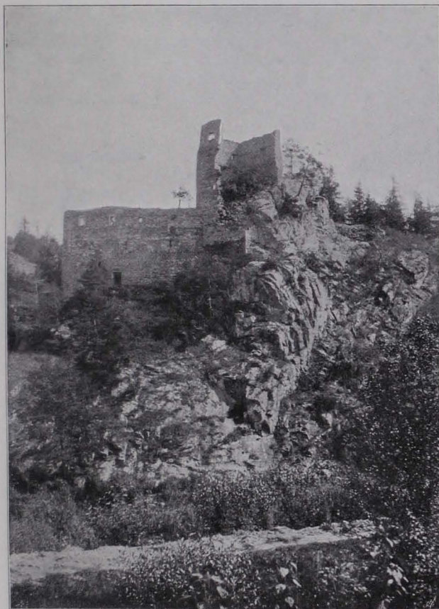
Fig. 63 Eibenstein, Ruine (S. 60)

Der allseits steil abfallende Kirchenhügel ist zum Teil mit Futtermauern gestützt, zum Teil mit einer Mauer abgeschlossen. Im W. segmentbogiges Haupttor unter Flachgiebelabschluss.