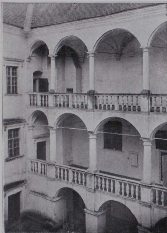
Fig. 61 Gutshof Drösiedl, Hof (S. 57)

Schloß, im Besitze des Stiftes Altenburg. Über die älteren Besitzer siehe oben. In dem Kodex 14.763 der Hofbibliothek in Wien befinden sich zwei Inventare von Dr. von 1611, beziehungsweise 1615. In ersterem wird das Schloß mit dem Meierhofs auf 1500 fl. geschätzt, im zweiten das Schloß wie dasselbige inwendig mit seinen Zimmern, Gewelben, Khellern und andern mehr darinnen vorhanden Gemachen und ainem rings umb Schloss geführten Graben, Zwinger und Mauer ein- und umbfangen und erpaut worden, darinnen ein Herr mit seinen nothwendigen Zimbern zu der Bewohnung wohl versehen ist etc. auf 2000 fl. angeschlagen.