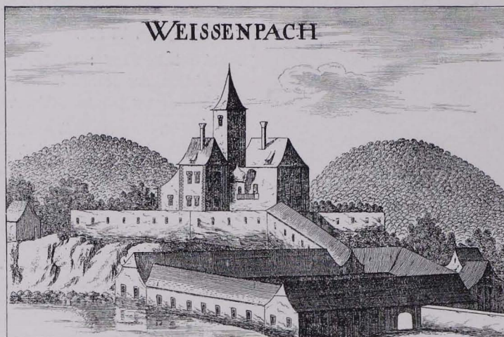
Fig. 36 Weißenbach, Ansicht von 1672 nach der Radierung von G. M. Vischer (S. 32)

Ortskapelle. Ortskapelle: Rechteckig, mit abgeschrägtem Chore; Schindelsatteldach mit kleinem, hölzernem Dachreiter, darauf Zeltdach. Anfang des XIX. Jhs.