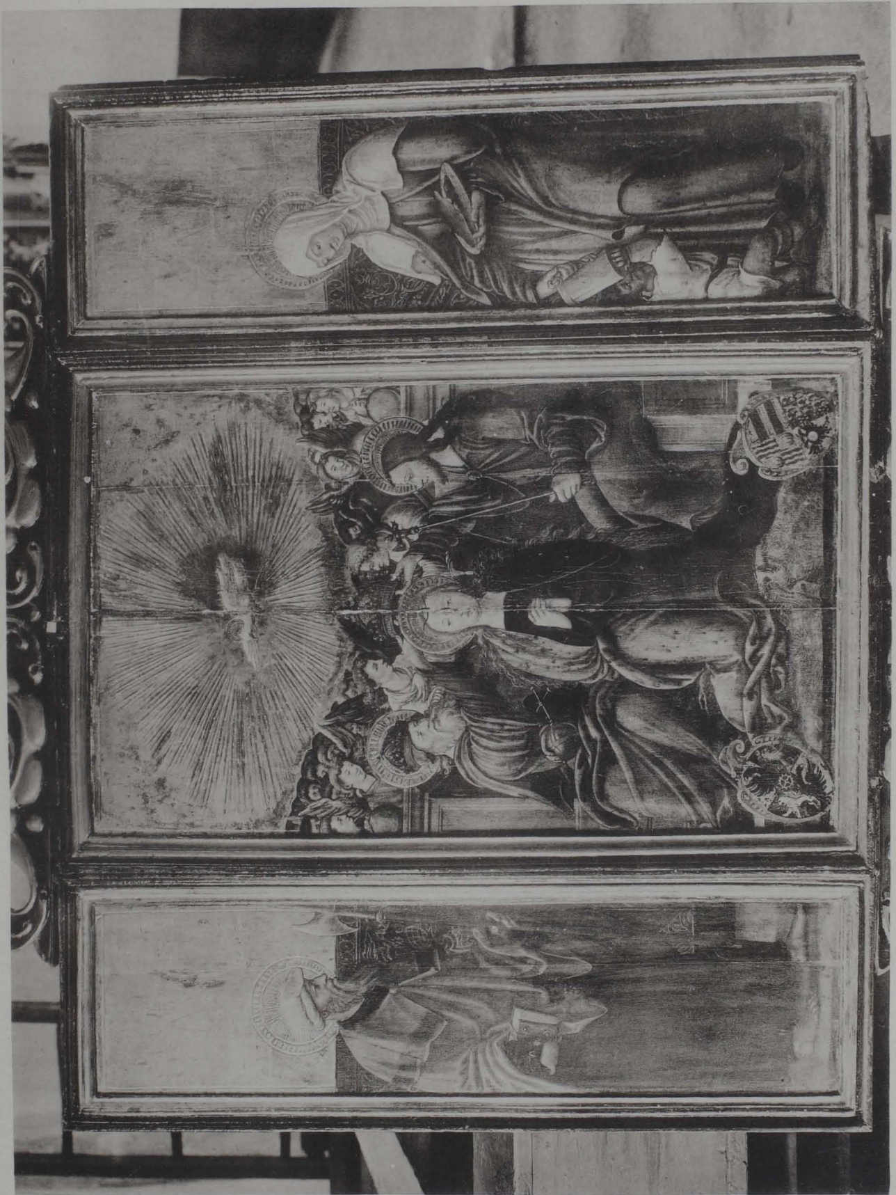
TAFEL III WEISSENBACH, FILIALKIRCHE, FLÜGELALTAR (S. 33)