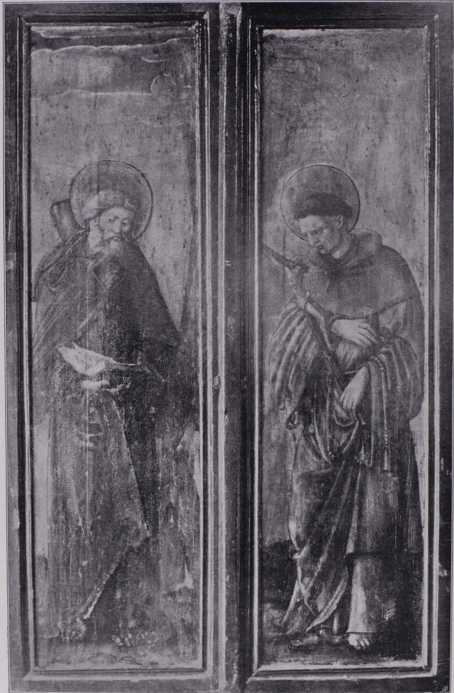
Fig. 38 Weißenbach, Fialkirche, Flügelaltar, Außenbilder (S. 33)