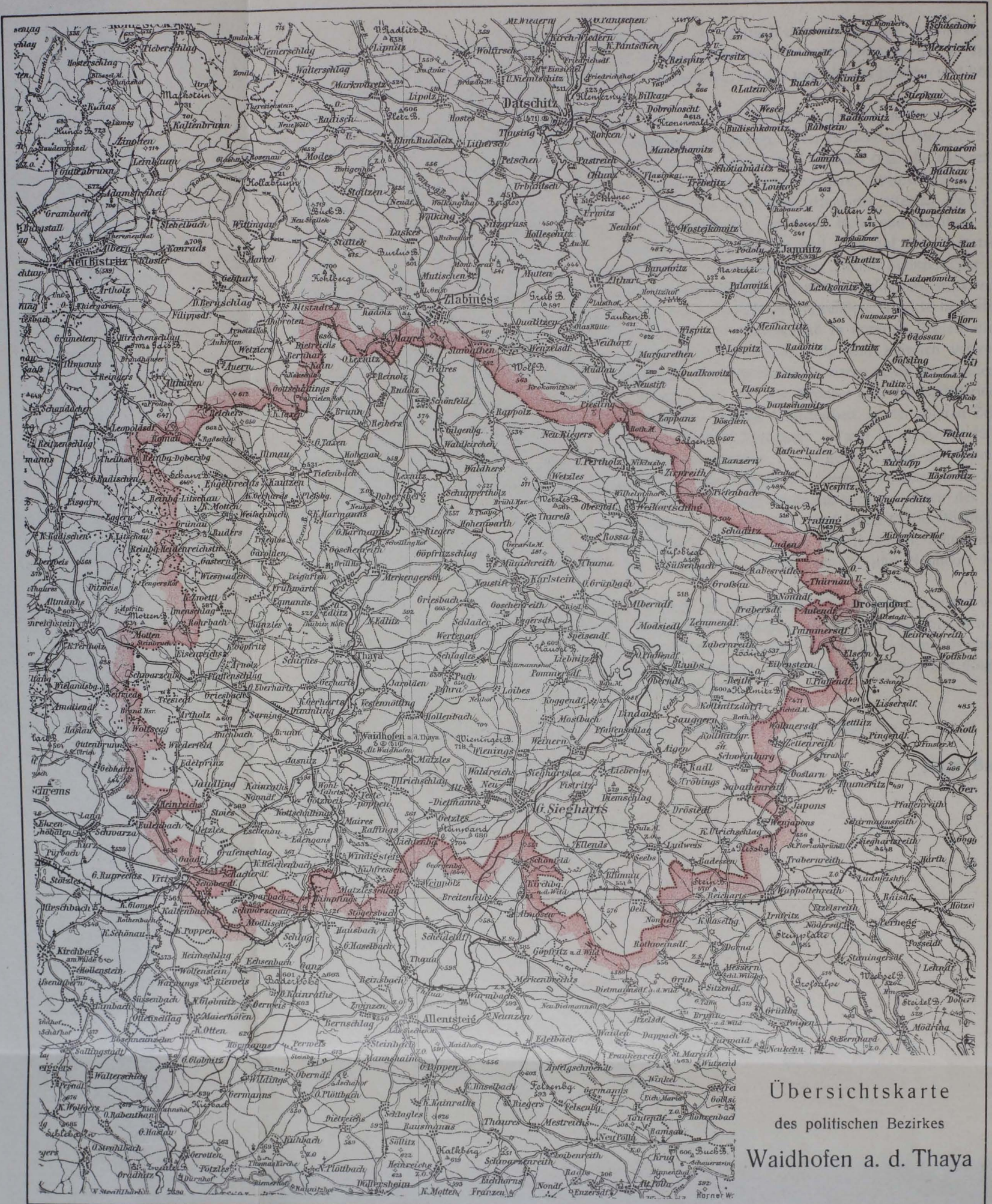
Übersichtskarte des politischen Bezirkes Waidhofen a. d. Thaya