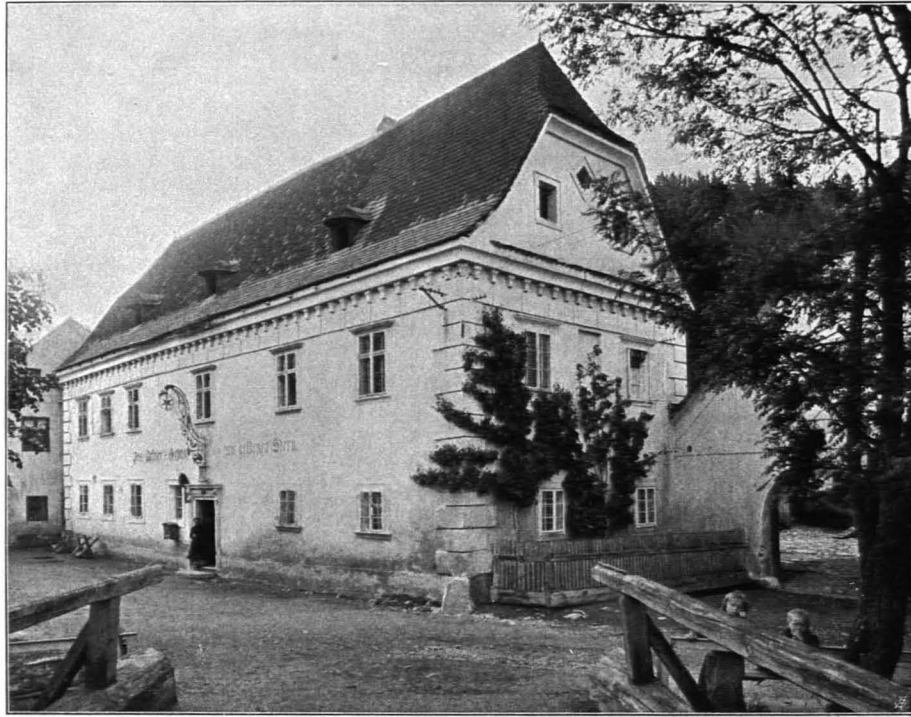
Fig. 438 Zwettl, Artners Gasthof (S. 469)

Neumarkt Nr. 7: Auf dem bis 1848 dem Stifte Zwettl gehörigen Hause wird seit 1580 ununterbrochen das Fleischhauergewerbe ausgeübt (unter den Familien Hengelmüller, Diechler, Neunteufel, Grabatsch, Wilfonseder). Daneben standen in der Bürgergasse im XV. und XVI. Jh. Pfarrhof und Schule.