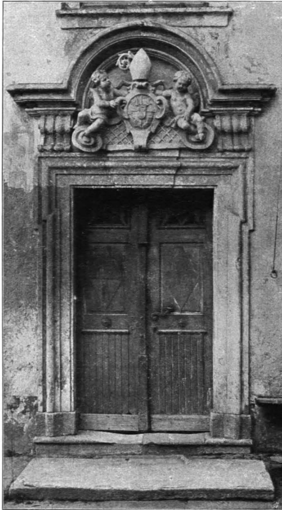
Fig. 401 Zwettl, Propstei, Portal (S. 435)

Kanzel: An der Mitte der nördlichen Langwand. Holz, rot marmoriert, mit vielen vergoldeten Zieraten. Runde Brüstung, Ablauf auf Konsole aufruhend. Reiche Verzierung mit vergoldetem, geschnitztem Ranken- und Bandwerk. Am Wandteile jederseits geschnitzte, vergoldete Blume mit Blattwerk. Am Baldachin Quastenbehang, unten Taube des Hl. Geistes, oben drei Putti, Holz, polychromiert, auf der Bekrönung das Symbol des Evangelisten Johannes, ein großer schwarzer Adler mit Feder im Schnabel und dem Buche mit den sieben Siegeln in den Fängen. Erste Hälfte des XVIII. Jhs. (Fig. 397).