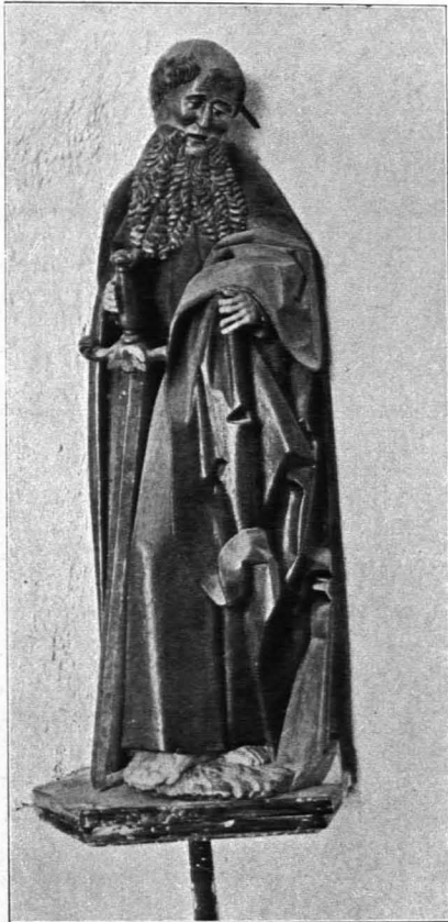
Fig. 383 Waldhausen, Pfarrkirche, Apostel Paulus (S. 417)

2. Zwei Seitenaltäre mit einfachem Aufbau, Holz, polychromiert, modernes Bild mit zwei flankierenden toskanischen Säulen. Ende des XVIII. Jhs. (Die alten geringen Altarbilder im Pfarrhofe.)