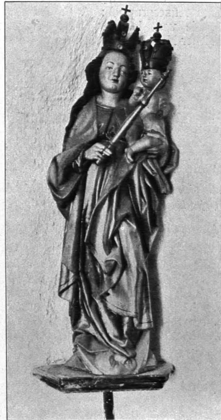
Fig. 385 Waldhausen, Pfarrkirche, Mutter Gottes mit dem Kinde (S. 418)

Kanzel: Holz, marmoriert, sehr einfach, geschwungene Brüstung mit Stiege, Baldachin. Ende des XVIII. Jhs.