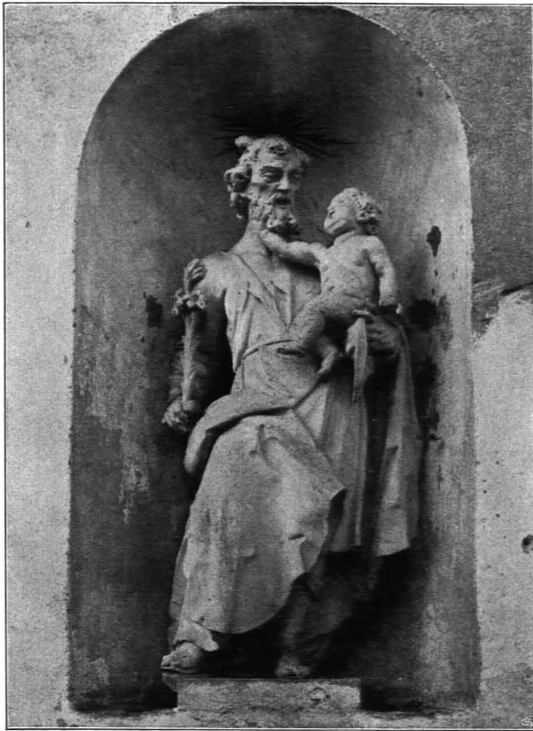
Fig. 357 Schloß Rosenau, Statue des hl. Josef an der Südseite der Pfarrkirche (S. 387)