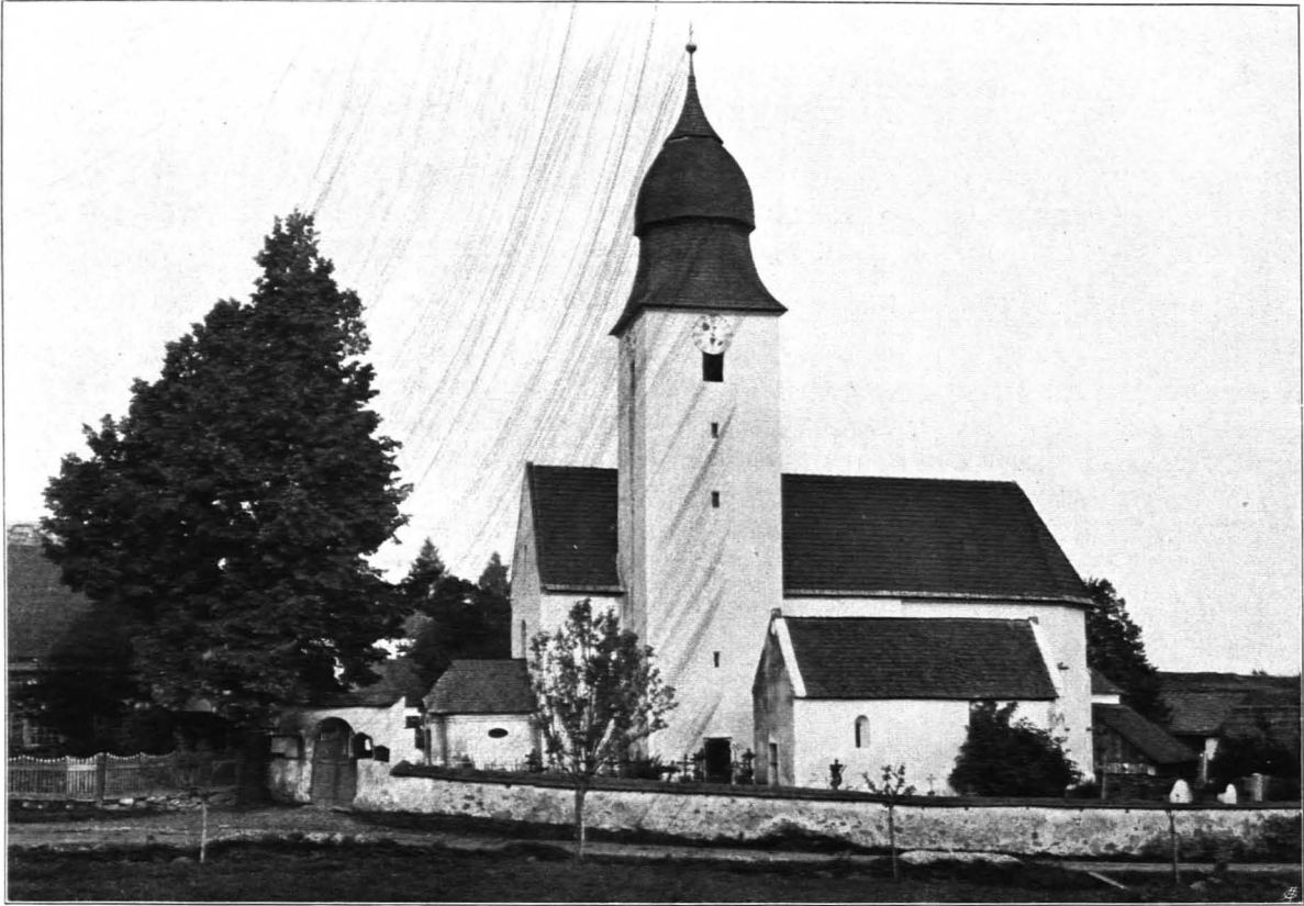
Fig. 329 Marbach am Walde, Pfarrkirche, von Süden (S. 353)

hergestellt und erhielt zwei neue Glocken. 1845 Restaurierung der Altäre. 1854 Ankauf eines Fastenbildes, Christus am Kreuze, 1857 Aufstellung eines Hl. Grabes, 1864 neuer Kreuzweg, 1865 neue Orgel, 1884 vollständige Restaurierung der Kirche.